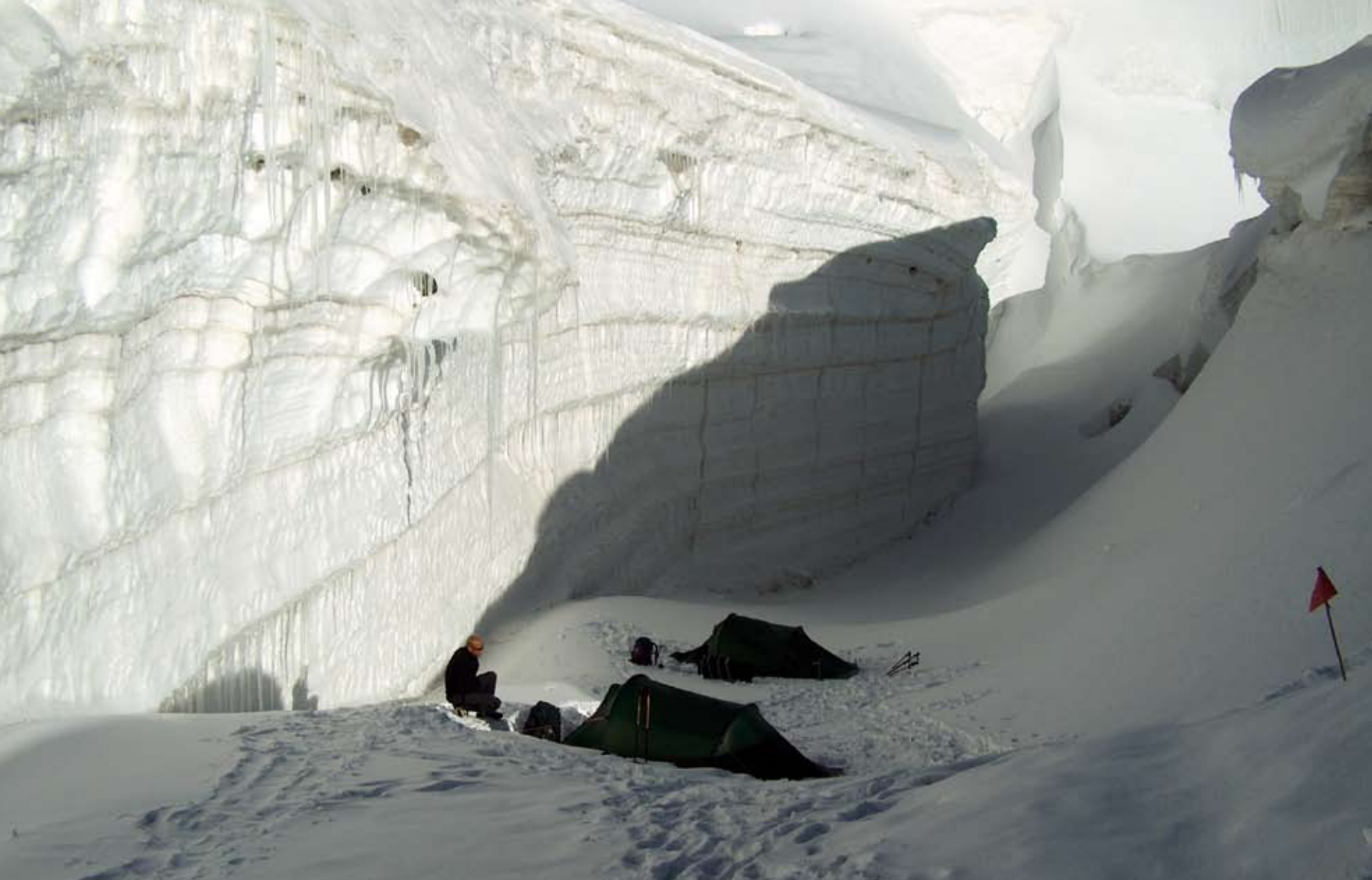
Lejr 3 (5920m) i en stor gletscher spalte - godt beskyttet fra vinden.