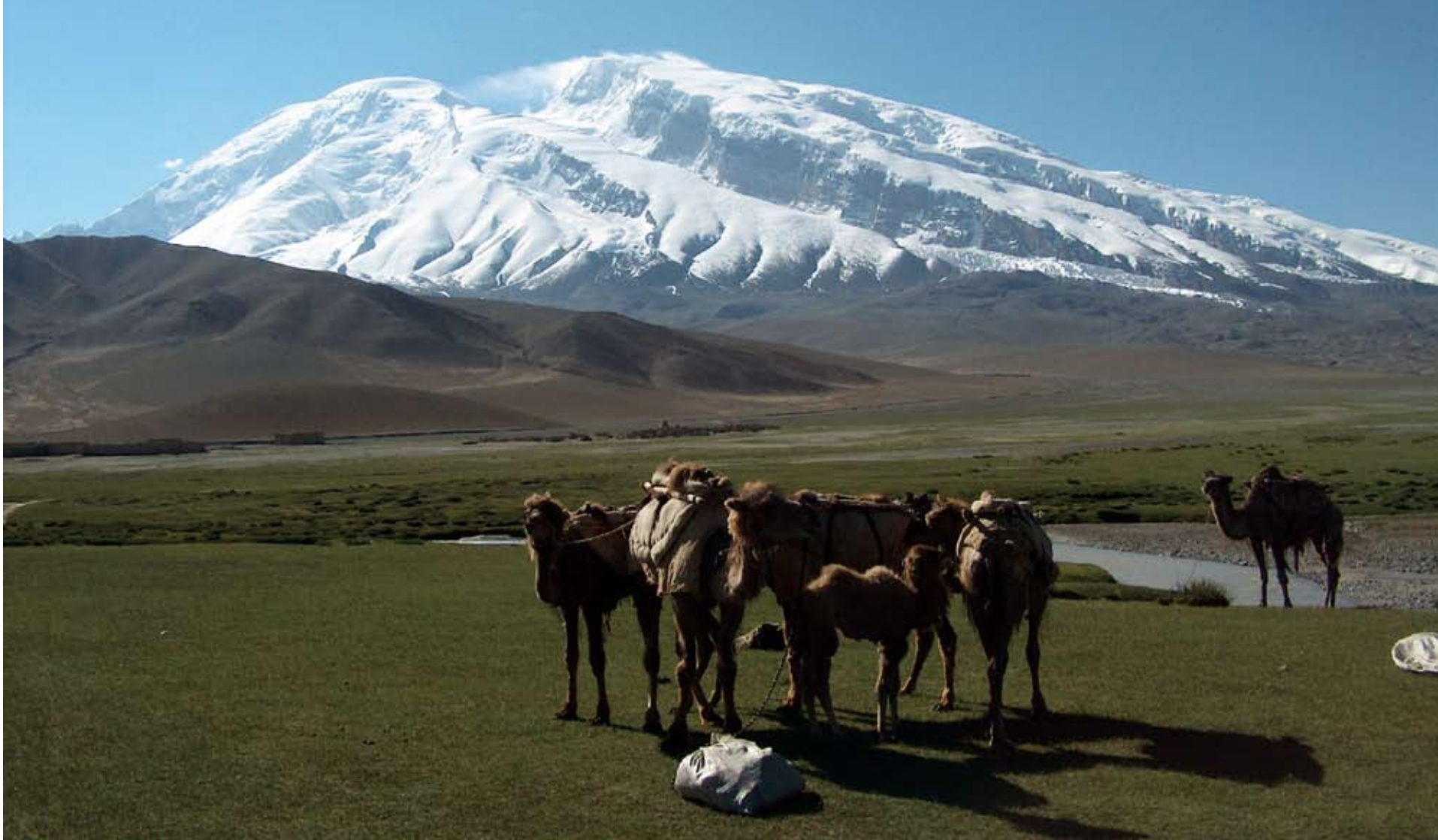
Transportkameler foran bjerget Mustagh Ata. Ruten går ad snerampen i midten fra højre til venstre.