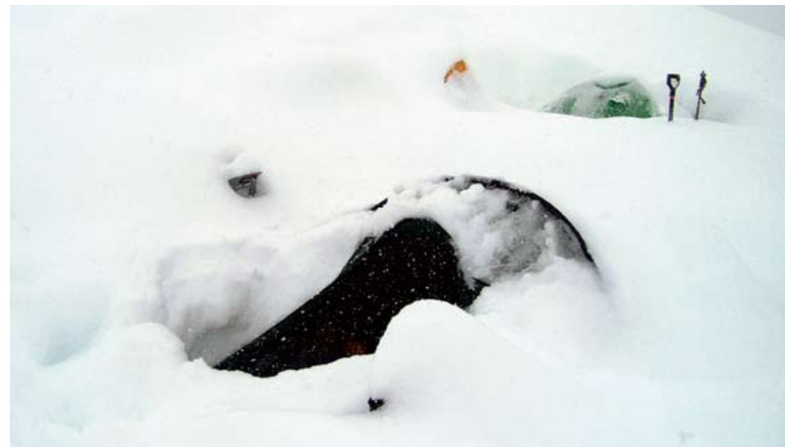
Efter tre dage med snestorm i lejr 4 (6180m) er vi ved at sne inde. Her ses indgangen til vores Hilleberg Nallo2 telt.....

Næste dag hvor vi skal gå videre er det dog en anden sag. Det er igen tåget og sigtbarheden er lav. Sporet er mere eller mindre sneet til, så eneste holdepunkt er wands (bambuspinde med flag på) som er sat med 50-100m mellemrum af tidligere ekspeditioner. Ofte må vi vente 5-10 min ved en wand, før vi kan få øje på den næste i den varierende tåge. Vi kommer dog langsomt men sikkert fremad og kommer til camp 2 i 6180m efter nogle timer. Vi vil dog gerne lægge vores