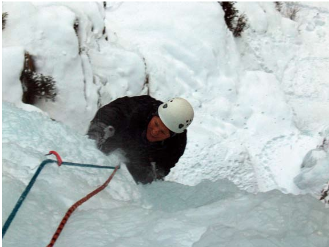
Field of Dreams