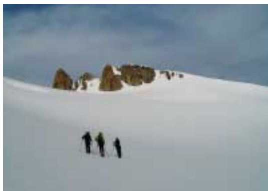
Smukke udsigter over Glacier des Grands

i år da der er en kæmpe spalte under Mont-Blanc de Tacul som skal passeres og med en serac ovenover som kan ryge når som helst!". I betragtning af hvor mange vilde & dygtige skifreaks der er i Chamonix og som ikke havde lavet ruten, var det ikke svært at forstå beskeden – hold jer væk! Så det gjorde vi, og skibesteg derfor Mt. Buet (3086m) istedet. Det er en flot top i Le Aiguilles Rouges massivet som således ligger på den anden side af Chamonix dalen i forhold til Mont Blanc. Vi havde set den markante snetop flere gange under kurset og den havde et face der så ud til at byde på lækkert skiløb. Ruten opad gik ad den sydvestlige grat og det gik fint - de 1800 højdemeter kunne dog godt mærkes da vi nåede toppen. Det blev dog hurtigt glemt da man så den fantastiske udsigt: Bedre platform til at se hele Mont Blanc massivet findes vist ikke!