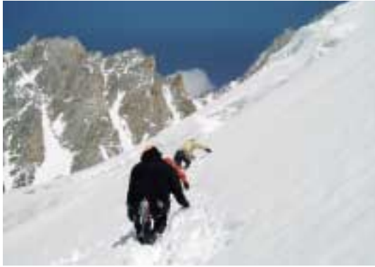
Teamet på vej op til en "bergschrund" på Glacier des Améthystes.

Bip, bip, bip, bip – hvem fan... har sat sit vækkeur til at ringe så tidligt!? Åh, hvor jeg elsker alpin starter! Man er placeret på værelse efter hvornår man skal op, så hurtigt bipper alt omkring én. Vi skal jo helst op ad gletcheren inden sneen bliver til noget der gør sig bedre i en "Slush Puppy". Heldigvis bliver det hurtigt lyst på den årstid, så pandelampen bliver kun anvendt til at finde rundt i det begyndende kaos på værelset. Morgenmad med søvn i øjnene og så afsted mod nye triumfer. Som sagt skulle vi nu op over Col du Chardonnet som også ligger på normalruten af "Le Haute Route" til Zermatt, så det er ikke en overraskelse at stå ved foden af gletcheren og gøre skiene klar til opstigningen sammen med adskillige guidede grupper. Starten er noget stejlere end øvelsesterrænet fra dagen før, men det går overraskende godt og vi fik således hurtigt overhalet de guidede grupper og skabt lidt luft.