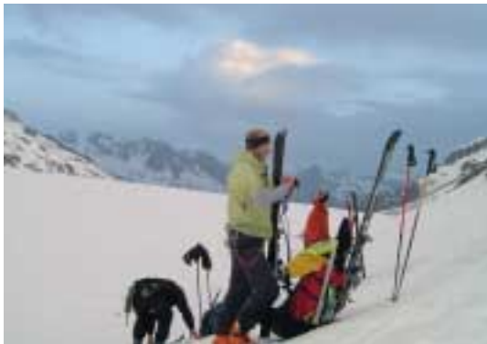
Smukt morgen lys, hvor fellerne sættes på skiene inden Glacier du Chardonnet udfordres.

Passet nåes i fin stil, og den anden side er smal, stejl og befærdet, så vi vælger ligesom de fleste andre at rigge et reb til og abseile ned. Dagens mål er Cabane du Trient hytten i Schweiz som vi når via to pas (Fenêtre du Tour, 3414m, og Col du Tour, 3282m) til & fra Glacier du Tour fremfor normalruten direkte til Plateau du Trient. Dette giver lidt mere fred for de guidede grupper og desuden to spændende udfordringer. Det første pas er meget stejlt og tester således hvor gode vores "klik"-vendinger er blevet. Resultatet var desværre ikke noget at prale af – 888, 887, 886 – stadig lang vej til de 1000 vendinger.... Udfordringen i Col du Tour var at der ikke var sne hele vejen, så nu fik vi også mulighed for at vise for klatre-evner i randonnée-skistøvler med "momentum-enhancers" (=ski) spændt på rygsækken!